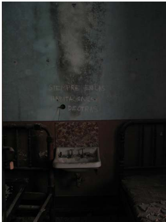
primavera...invierno, 2005 Fotografía digital 100 x 70 cm. Edición de 5 + 2 P/A