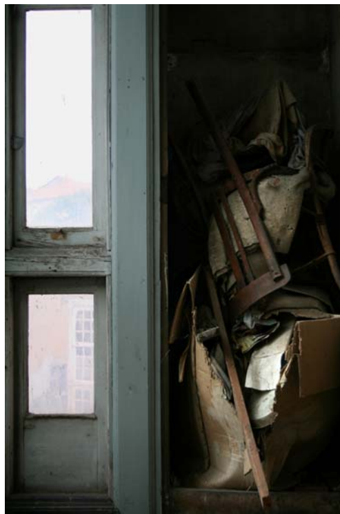
aquí es donde los escondo, 2006 Fotografía digital 105 x 70 cm. Edición de 5 + 2 P/A