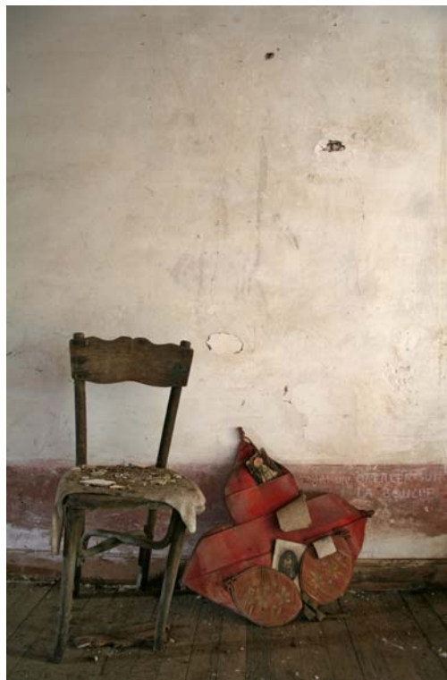
R. [detalle], 2008 Instalación compuesta por: Fotografía digital ed. 7 + 2 P/A [114 x 76 cm.] y objetos encontrados. Dimensiones variables

En sus obras siempre presenciamos un valor de lo escrito, de la caligrafía, del testimonio. Así, estos murales, cruce de dibujos y objetos, documentos, ofrecen esa discreción del elemento cotidiano, habitual, de lo confesional, del testimonio. Murales formados de imágenes, emblemas que actúan de pequeños relatos narrados, en la esencia de lo escenográfico, de una habitación privada conformada de recuerdos, de vivencias, de dudas, incorrecciones desde una experiencia literaria. Traslado el mismo aparente orden/desorden que se observa en sus fotografías, de muebles cubiertos de polvo, descuidados, a murales que traducen una construcción cotidiana, en tránsito, en proceso. Siempre esa dualidad entre lo público y colectivo, ficción y realidad, una buscada dimensión que bebe de una primera persona, de quien escribe, narra, y se proyecta a una colectividad. Obras que protagonizan una expansión en las paredes, como un mapa de experiencias, un territorio intermedio, sucesión de estratos que reconocen los signos, los relatos, lo posible, lo eventual, siempre en las claves del tiempo, de la memoria.