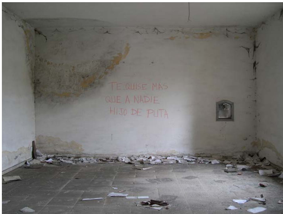
1 de nov. 2000 a 24 de nov.2003, 2004 Fotografía digital 75 x 100 cm. Edición de 5 + 2 P/A