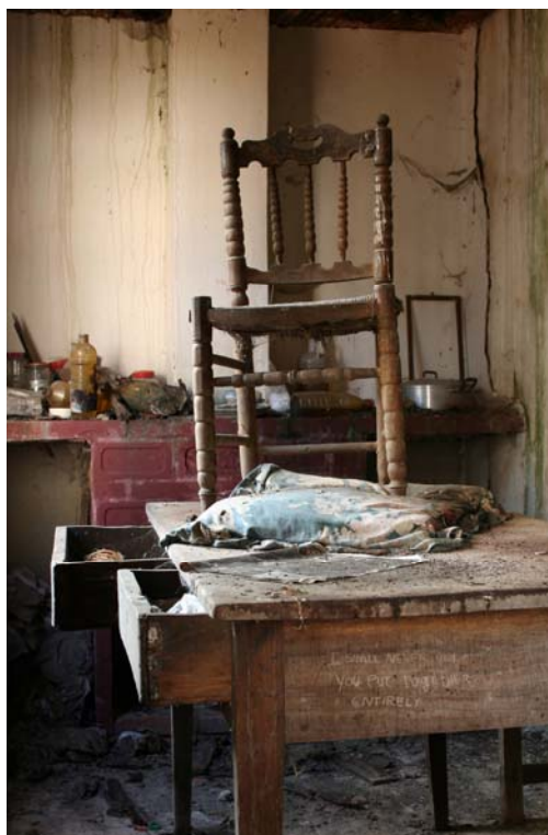
S.P. [detalle], 2008

Pequeñas y contundentes frases aparecen en espacios abandonados. Sus fotografías traducen perfectamente una sensación de pasado, de memoria atrapada, en paredes olvidadas desposeídas de habitantes. Confesiones en forma de monólogos que ofrecen una conexión con una parte vivencial, experimentada, del posible inquilino. Asistimos a frases que resumen una actitud, un sentimiento, siempre pretendidamente social, muchas veces incómodas, necesarias, que fusionan lo colectivo con lo individual. Será la lectura por parte del visitante lo que activa la historia que se esconde, que se pretende denunciar. Por eso mismo, no resulta casual que sus obras nos hablen de una violencia o drama oculto, silenciado, visible únicamente entre las entrañas del mobiliario, en las sombras de las puertas o ventanas. Un sutil diálogo que se destina a interrogar nuestro propio tiempo.