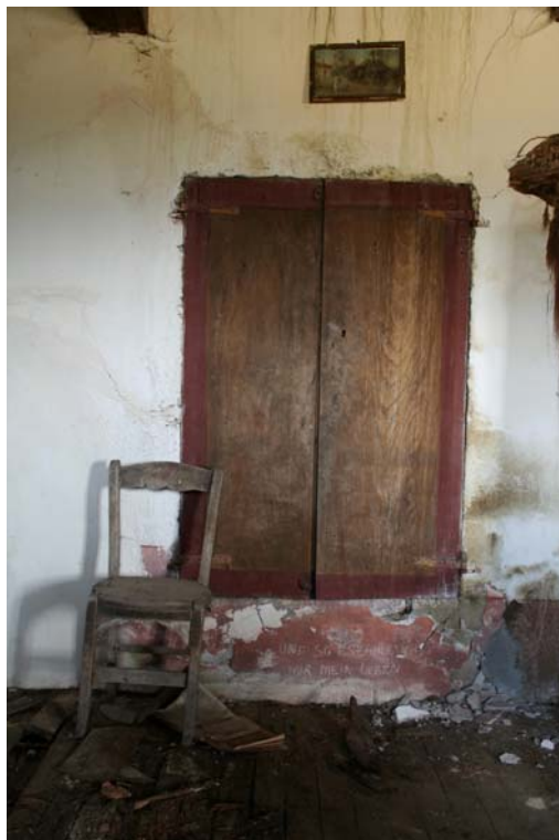
N. [detalle], 2008 Instalación compuesta por: Fotografía digital ed. 7 + 2 P/A [114x76 cm.] y objetos encontrados . Dimensiones variables

Antía Moure [Monforte de Lemos, Lugo, 1981] está licenciada en Bellas Artes por la Universidad de Vigo. Su joven pero destacada trayectoria creativa viene determinada por la presencia en destacados certámenes como "Premio Auditorio de Galicia", "Novos Valores"; proyectos de la importancia del "Observatori" o por su participación en destacadas exposiciones de tesis, como "Urbanitas" realizada en el MARCO en 2005 o "Fisuras en lo cotidiano" en 2006. Su obra estuvo presente en ferias de arte como ARCO, D'FOTO, China International Gallery Exposition de Beijing o Bridge Art Fair de Nueva York.