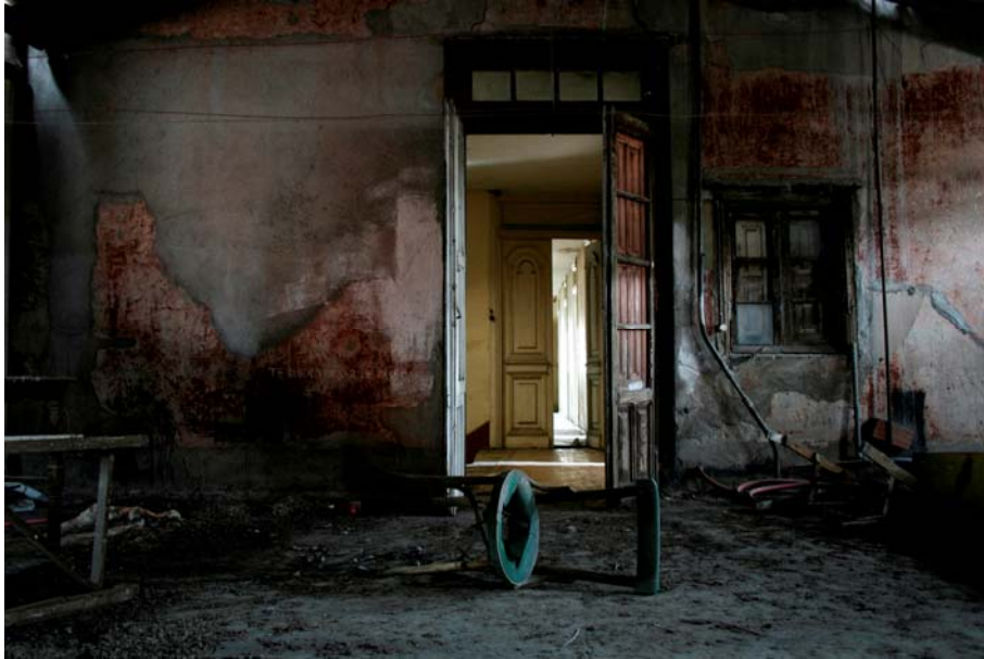
otro diciembre, 2007 Fotografía digital 89,98 x 134,99 cm. Edición de 5 + 2 P/A