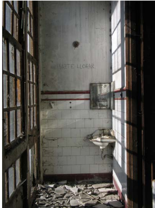
7 de junio, 2005 Fotografía digital 100 x 70 cm. Edición de 5 + 2 P/A