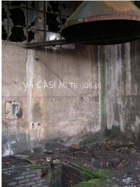
25 de noviembre, 2004 Fotografía digital 100 x 75 cm. Edición de 5 + 2 P/A