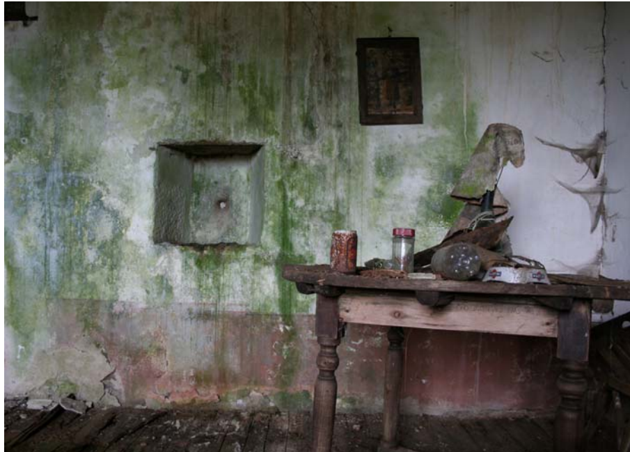
1977, recuerdo, 2006 Fotografía digital 75 x 105,08 cm. Edición de 5 + 2 P/A