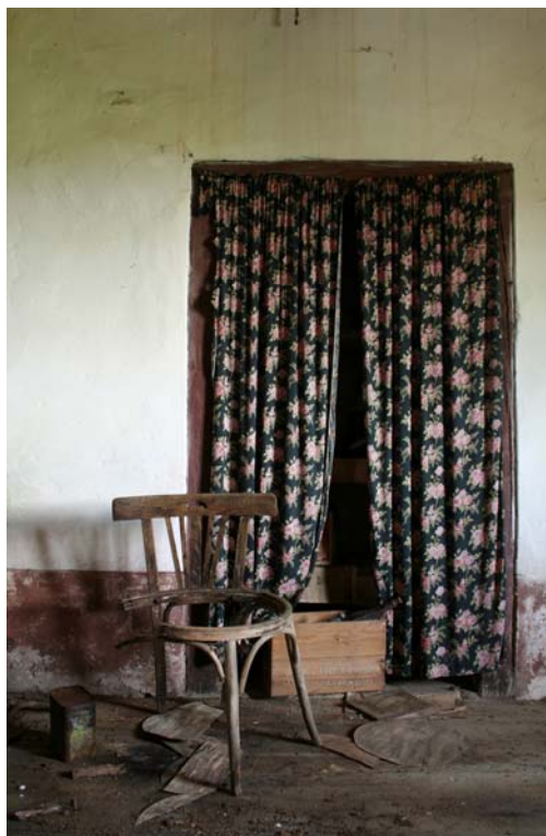
C.B. [detalle], 2008 Instalación compuesta por: Fotografía digital ed. 7 + 2 P/A [114 x 76 cm.] y objetos encontrados. Dimensiones variables

El presente proyecto "yo también me acordaré de todos vosotros", pensado y producido para el espacio de la galería ASTARTÉ, ofrece claves definidas de su trabajo, desde la palabra a lo fotográfico, la memoria y el documento, el testimonio, para profundizar en una clave escenográfica, ambiental. Se insiste en una vinculación en los márgenes de sus trabajos, en un diálogo cruzado entre diversos soportes, que no se centra únicamente en lo fotográfico, sino que se apuesta por una narración de fragmentos, secuenciado en un relato estructurado desde la lectura de seis escritores/pensadores, Baudelaire, Borges, Nietzsche, Rimbaud, Sylvia Plath y María Zambrano, curiosamente seis autores que reflexionaron sobre la vida desde una visión fragmentada y poliédrica, compleja. Seis murales organizados a partir de la relectura de una frase, concreta y casi azarosa, dentro del magma creativo e intelectual de cada uno de ellos. Cuando la literatura penetra en la experiencia vital, en un pasado que precisa leerse en clave reconstruida, casi desde el fragmento, arqueológico, pendiente de su interpretación. Antía Moure dispone los canales de esa metaliteratura instalada.