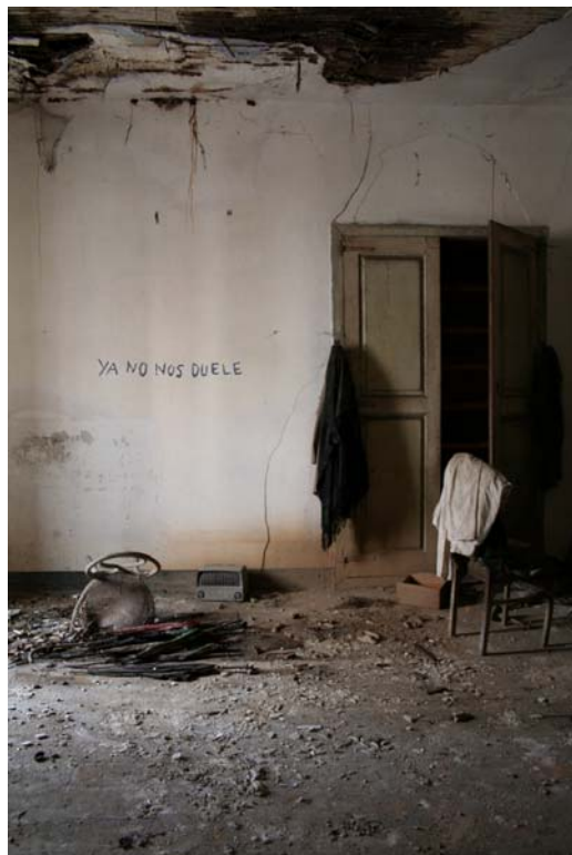
19 de agosto, la vuelta, 2005 Fotografía digital 100 x 70cm. Edición de 5 + 2 P/A