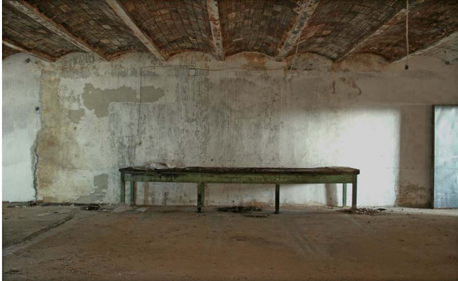
12:37:54, 2008 Fotografía digital 91 x 138 cm. Edición 5 + 2 P/A