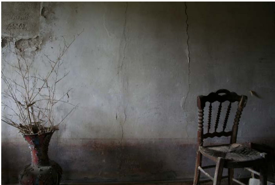
Hiroshima, mon amour, 2006 Fotografía digital 75 x 112,5 cm. Edición de 5 + 2 P/A